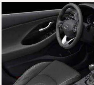
Oceanids Black - Bőr vagy szövet